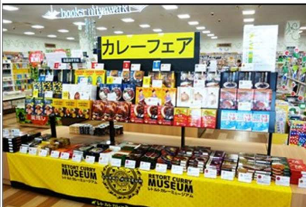
食品系: レトルトカレーミュージアム