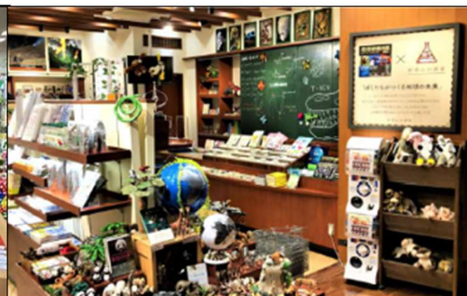
雑貨系: 好奇心の部屋