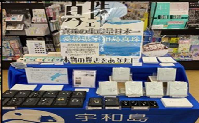
雑貨系: 宇和島真珠