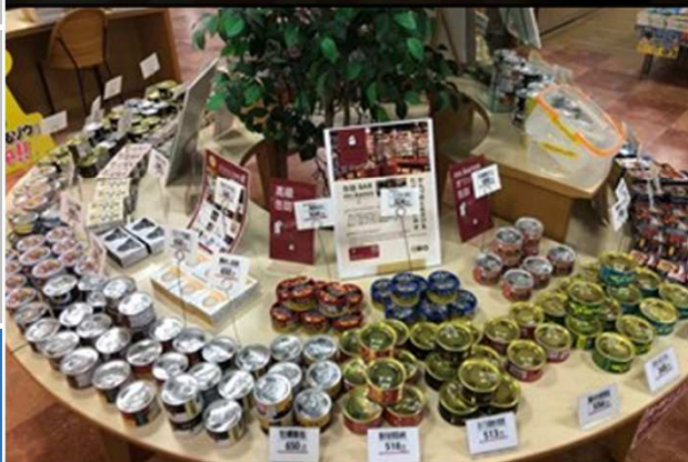
食品系: 缶詰ミュージアム