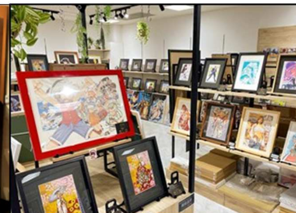
リユース系: 中古セル画販売