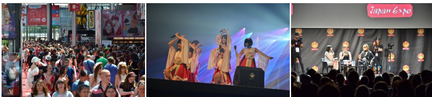
会場エントランス(左)、オフィシャルステージでの「虹のコンキスタドール」ライブ(中)、「We Are X」の上映にゲスト登場したYOSHIKI(右)

本日 JAPAN EXPO は最終日を無事に終え、4日間の会期中に総計570時間以上(トーハン調べ)のオフィシャルプログラムを実施、多くの来場者が最先端の日本のコンテンツ・文化に親しみました。また、「SAIKO! JAPAN」エリアもエリアステージにて33のオリジナルプログラムを実施。アイドルライブや着ぐるみショーをはじめ、多くの反響を得ました。4日間の概要をご報告致します。