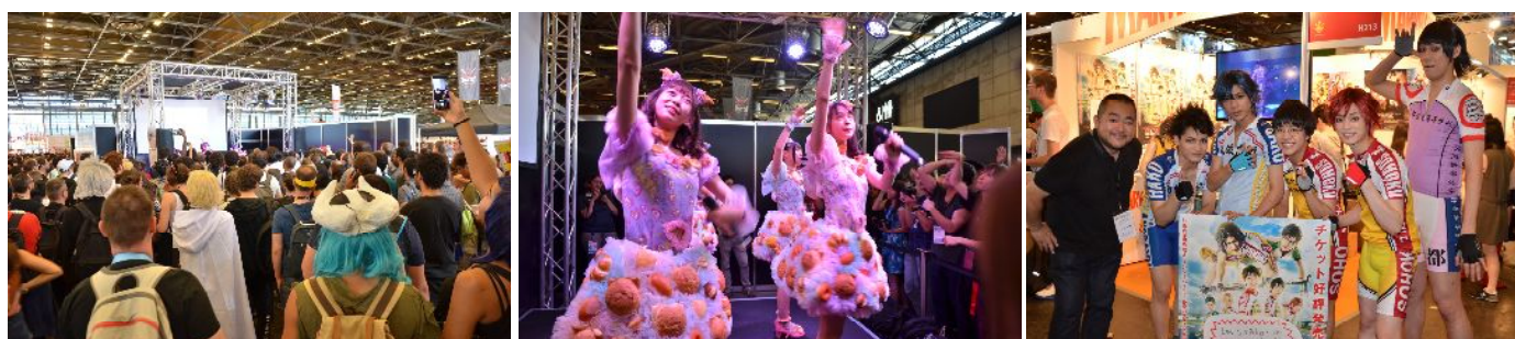
「SAIKO! STAGE」での「虹のコンキスタドール」ミニライブにも多くの観客が押し寄せた(左)、同「わーすた」ミニライブ(中央)、イベント前に舞台をPRする「舞台『弱虫ペダル』」キャストたち。

トーハンでは昨年からの「SAIKO! JAPAN」エリア公式SNSを活用した事前のプロモーション活動にも力を入れており、SNSの情報を見てエリアを訪れたという来場者も多数見受けられました。