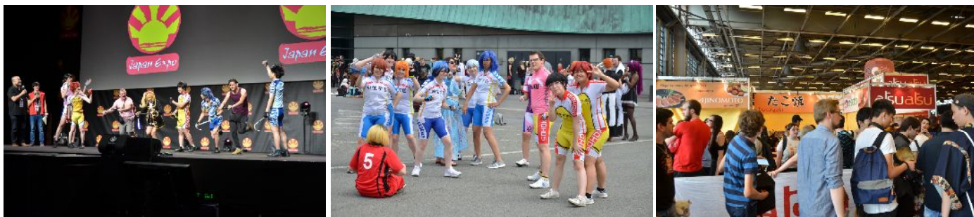
「舞台『弱虫ペダル』は指名された観客を相手に自転車漕ぎ演技のワークショップを行い、会場は大いに盛り上がった(左)、 集団で「弱虫ペダル」のコスプレを行う参加者(中)、たこ焼を買うために行列を作る参加者(右)