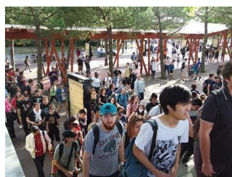
会場入口に向かう行列