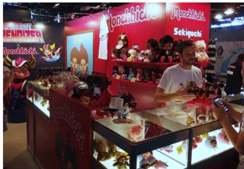
モンチッチはフランスでも大人気！

株式会社トーハンはJapanExpoのメインパートナーです。トーハンが運営する「Saiko!JAPAN」エリアは会場中央部に位置し、日本企業のブースを集めて会場を盛り上げています。今年は「ポケモンストア関西空港店」や「Cygames」など21社合計55ブースが出展し、4日間で延べ18万人以上の動員数を記録しました。