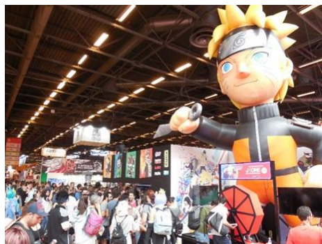
現地出版社も多数出展

2017年7月6日～9日、ヨーロッパ最大の日本文化の祭典「JAPAN EXPO」がフランス・パリで開催されました。今年4日間で23万8241人の来場を記録。多くのフランス人が最先端の日本のコンテンツ・文化に親しみました。18回目となったジャパンエキスポは、現地ではすでに夏の人気イベントとして浸透しており、近年はマンガ・アニメのファンだけでなく、一般のお客さんやファミリーでの来場が増えています。