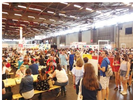
和食が食べられる飲食エリア