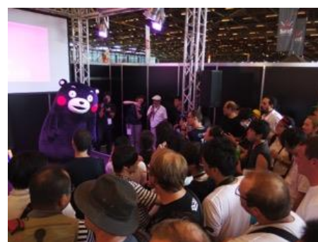
ゆるキャラを使った観光PRも盛況