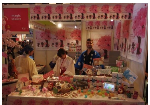
マジックサクラはすでにJapanExpoの定番に