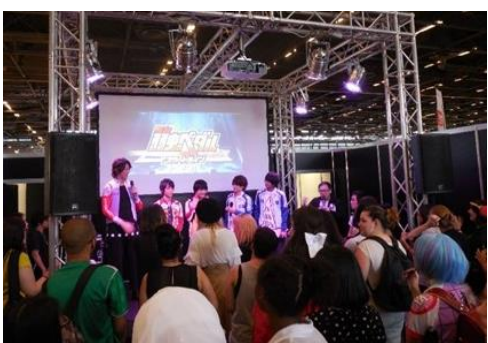
「ゆるキャラ」キャストによるトークショー