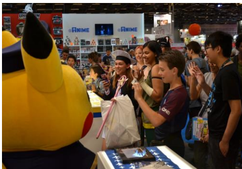
パイロットピカチュウの写真撮影