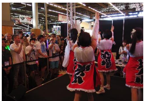
白熱するアイドルのステージ！

「Saiko!JAPAN」エリアには出展ブースのほかにステージも設置しています。今年はアイドルやミュージシャンのライブ、俳優によるトークショー、ゆるキャラによる特別観光PRイベントなど、合計33のステージプログラムを実施しました。