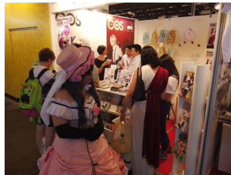
コスプレ写真撮影にも行列ができた